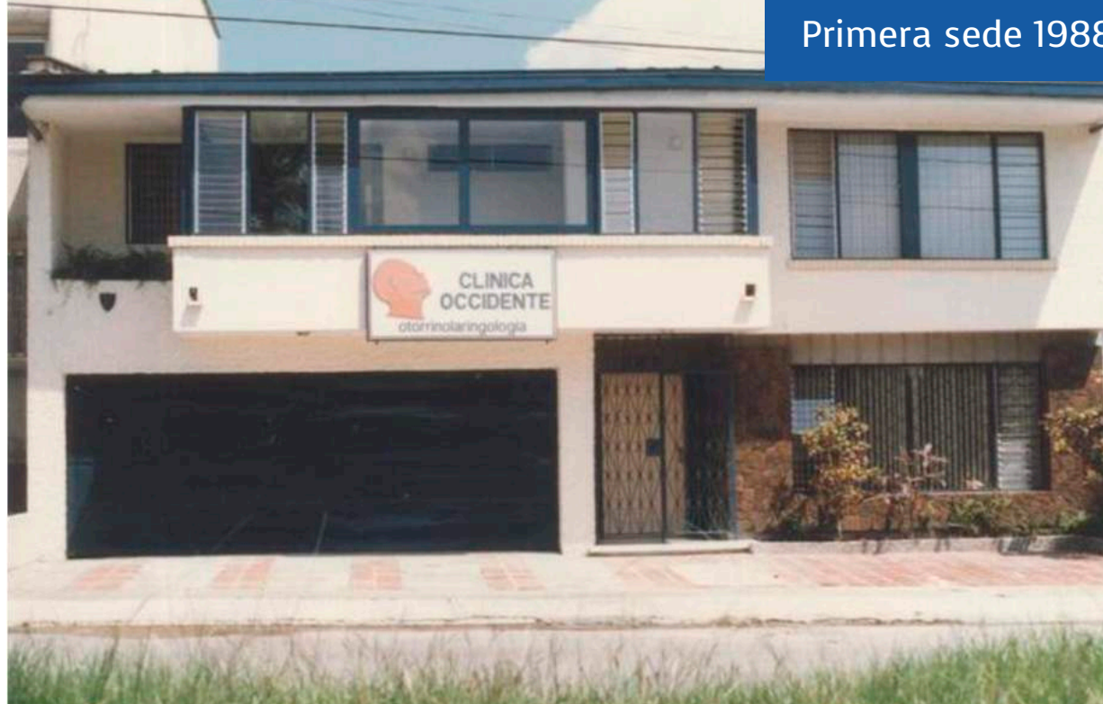
Primera sede 1988 - 1994

Se adquirió la primera casa en la esquina de la calle 34 con la 63. Se inició el proyecto y en esa se incluyó por primera vez la idea de tener una segunda recuperación, algo novedoso para su época, además de tener Radiología, laboratorio de alergias, 3 quirófanos y 8 consultorios, para dar cabida a los 9 socios nuevos que habían ingresado. La cual se inauguró luego de cinco años y medio de la primera sede, en las fecha de mayo de 1994.